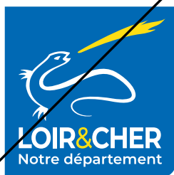
Changement de proportions