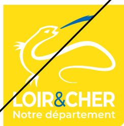
Inverser les couleurs

Exemples des transformations du logo interdites :