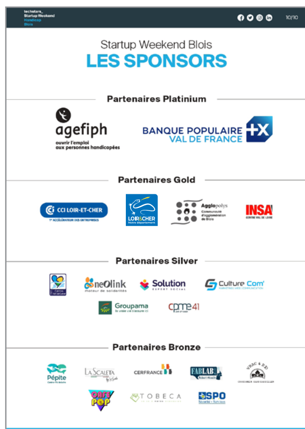
Exemple de communiqué de presse

Selon l'importance du projet et à la discrétion du conseil départemental, vous pouvez demander une interview d'un élu pour l'intégrer dans votre publication.