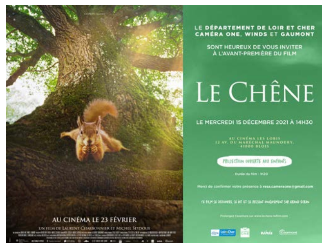
Exemple de carton d'invitation