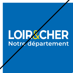
Dissocier les éléments