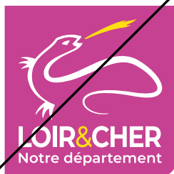
Changement de couleur