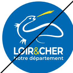
Changer la forme