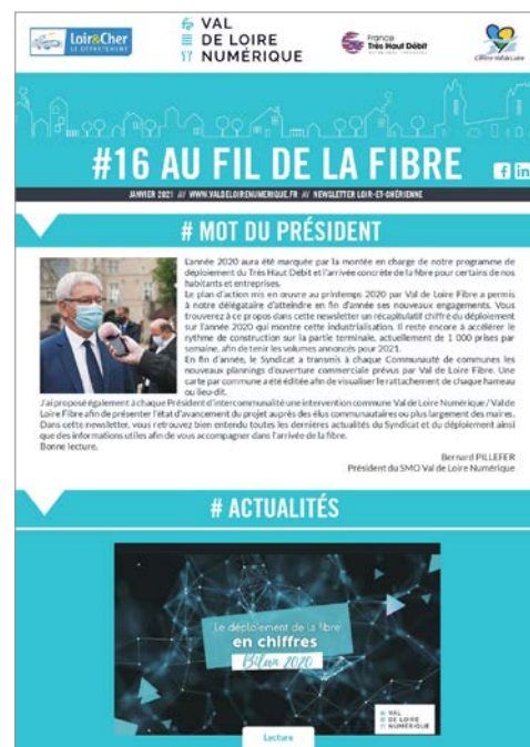
Exemple de Newsletter