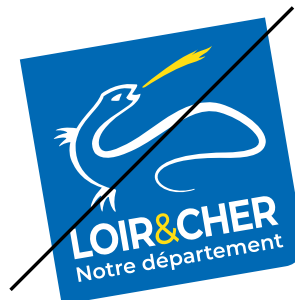
Incliner le bloc