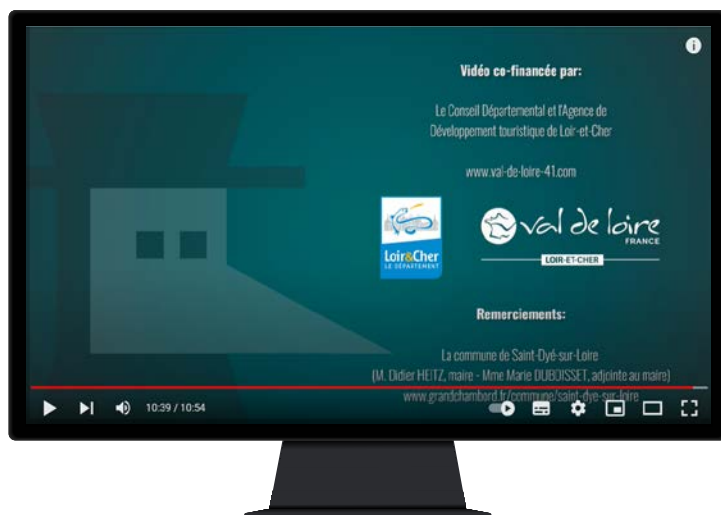
Exemple de vidéo