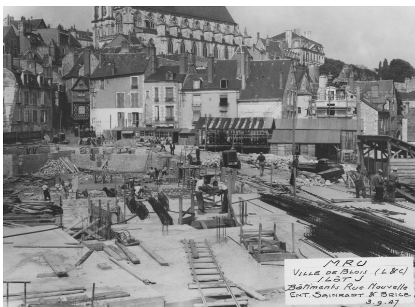
Reconstruction de Blois : bâtiments rue Nouvelle dans l'îlot J, 1947.

Ces derniers sont consultables en intégralité aux Archives départementales, sur le site de Vineuil.