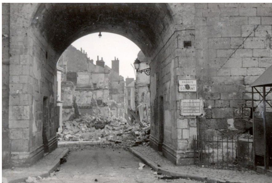
Vendôme : vue de la rue de la Poterie à travers la porte Saint-Georges, 1940. Photographie noir et blanc (fonds Michaël Fauvinet).

Organisée autour de plusieurs thématiques, l'exposition propose au visiteur un voyage dans le temps, au plus près des événements ayant frappé notre département pendant la Seconde Guerre mondiale.