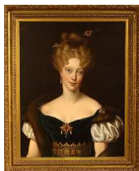
RAUCH, Charles Portrait de Marie-Caroline, duchesse de Berry. Huile sur toile, 2e quart du XIX e siècle Domaine national de Chambord