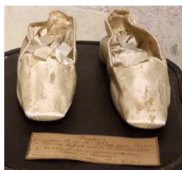
Paire de souliers de la duchesse de Berry. Cuir gainé de satin blanc, XIX e siècle Domaine national de Chambord ©N.Derré