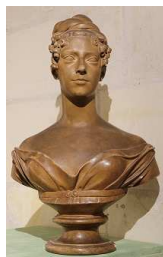
Anonyme Buste de Marie-Caroline, duchesse de Berry. Plâtre patiné terre cuite sur piédouche, XIX e siècle Domaine national de Chambord

Sur demande, nous pouvons vous fournir les visuels libres de droits pour la presse en haute définition.