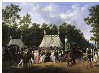
LECOMTE, Hippolyte (1781-1857) Louis XVIII recevant Marie-Caroline, duchesse de Berry, en forêt de Fontainebleau, à la croix de Saint-Hérem, le 15 juin 1816. Huile sur toile, 1817 Versailles, musée national des châteaux de Versailles et de Trianon