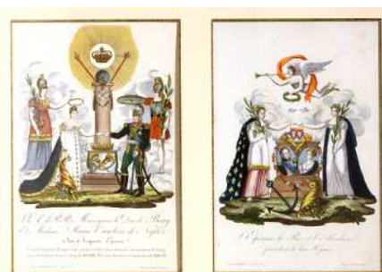
Deux scènes allégoriques de l'union du duc de Berry et de Marie-Caroline de Naples. « LL.AA.RR. Monseigneur le duc de Berry et madame Marie-Caroline de Naples, son Auguste Epouse » (n°1) et « L'Espérance, la Paix et l'Abondance président à leur hymen » (n°2). Lithographies coloriées, [s.d.] Dépôt du Musée de la Chasse et de la Nature Domaine national de Chambord